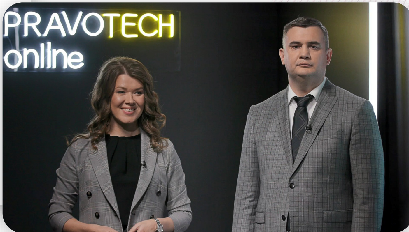
Спикеры в Малой студии

В день форума выступили 20 спикеров с практическими кейсами — в них рассматривали использование технологий в юридических процессах на примерах крупных компаний. Как внедрить чат-бота, автоматизировать судебные процессы и работу с документами — эксперты разобрали эти и другие нестандартные для юридической отрасли темы.