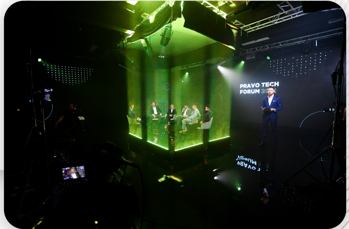
Так выглядела Большая студия в реальности

На часть светодиодного экрана выводились презентации, а оставшуюся площадь заняли динамический фон и логотип компании.