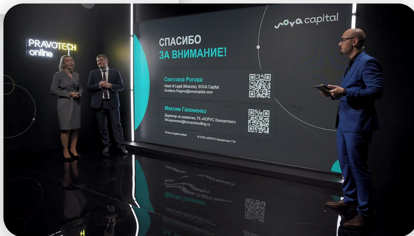
Светодиодный экран в Малой студии

Вторую студию оформили в соответствующей стилистике. На светодиодный экран транслировали презентации, а интерьер минималистично дополнили неоновым логотипом форума.