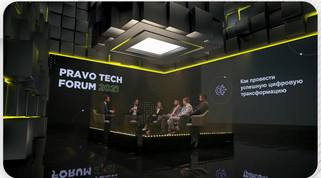
Так видели Большую студию онлайн-зрители

Главным визуальным элементом стал потолок, оформленный с помощью дополненной реальности — для наложения AR использовали камеру общего плана. Виртуальный световой куб над спикерами стал доминантной декорацией. Его дополнили объемные, подсвеченные зеленым кубы поменьше: они заняли одну стену целиком, а две других — до границ светодиодных экранов.