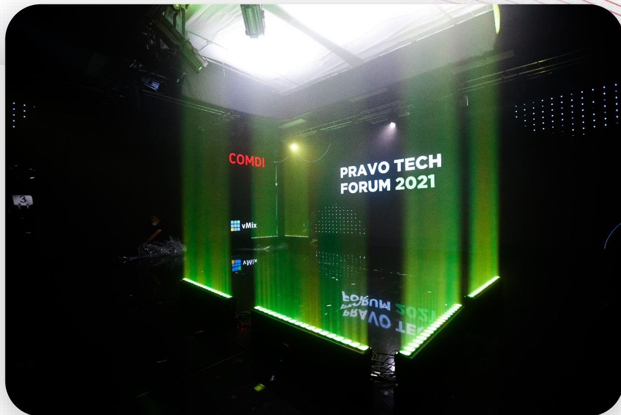
Подготовка к мероприятию, тестирование света в Большой студии

Визуальную концепцию на основе key visual мероприятия разработали профессиональный режиссер с оператором-постановщиком и художником по свету. В каждой студии работал светодиодный экран.