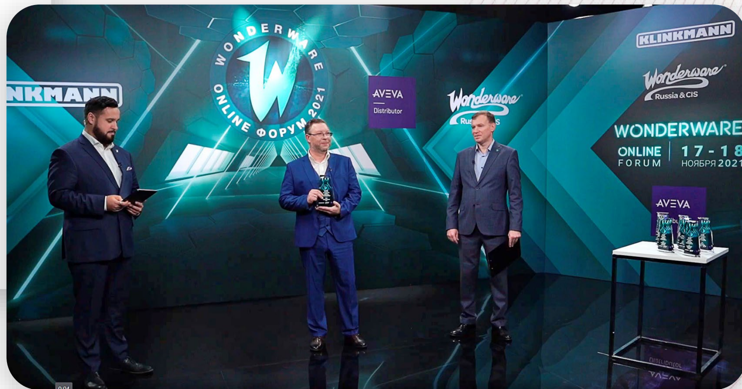
Награждение клиентов и партнеров

Форум завершился подведением итогов конкурса человеко-машинных интерфейсов, в которых участвовали компании-интеграторы, и розыгрышем Apple Watch. Такое окончание двух насыщенных дней мотивировало зрителей досмотреть трансляцию до конца, а чат и опросы на платформе COMDI помогли им почувствовать себя активными участниками.