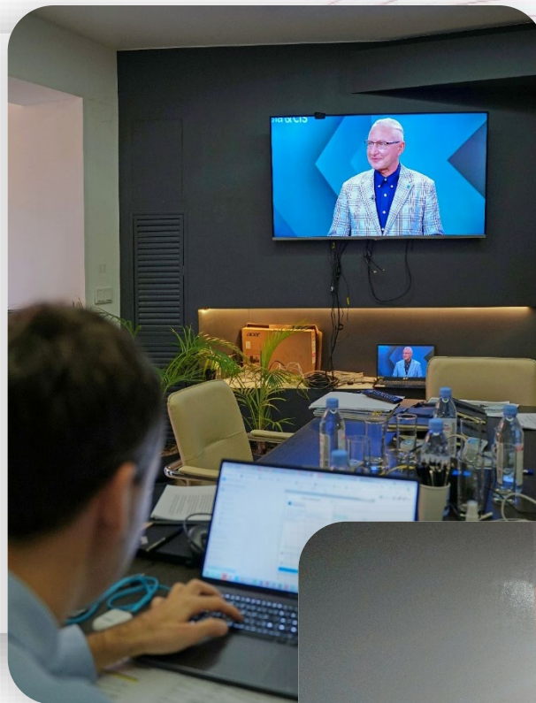
На экран в гостевую комнату транслировали эфир для спикеров, готовящихся выступить