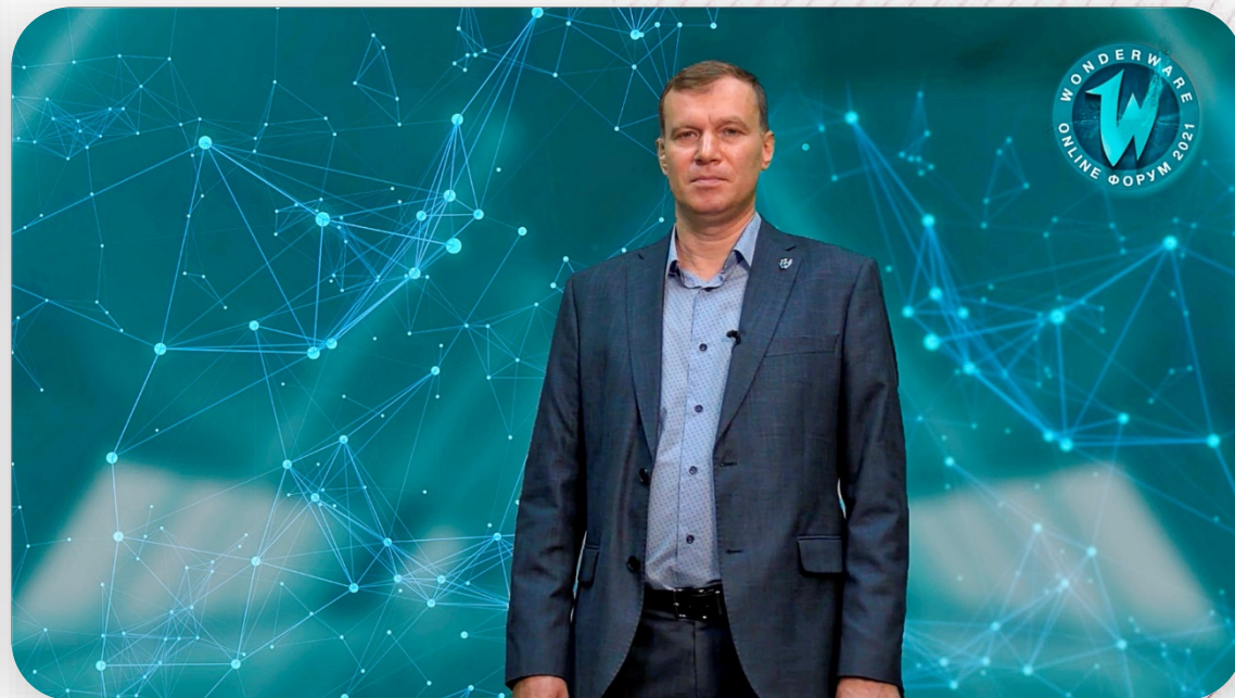
Виртуальный фон для ведущего