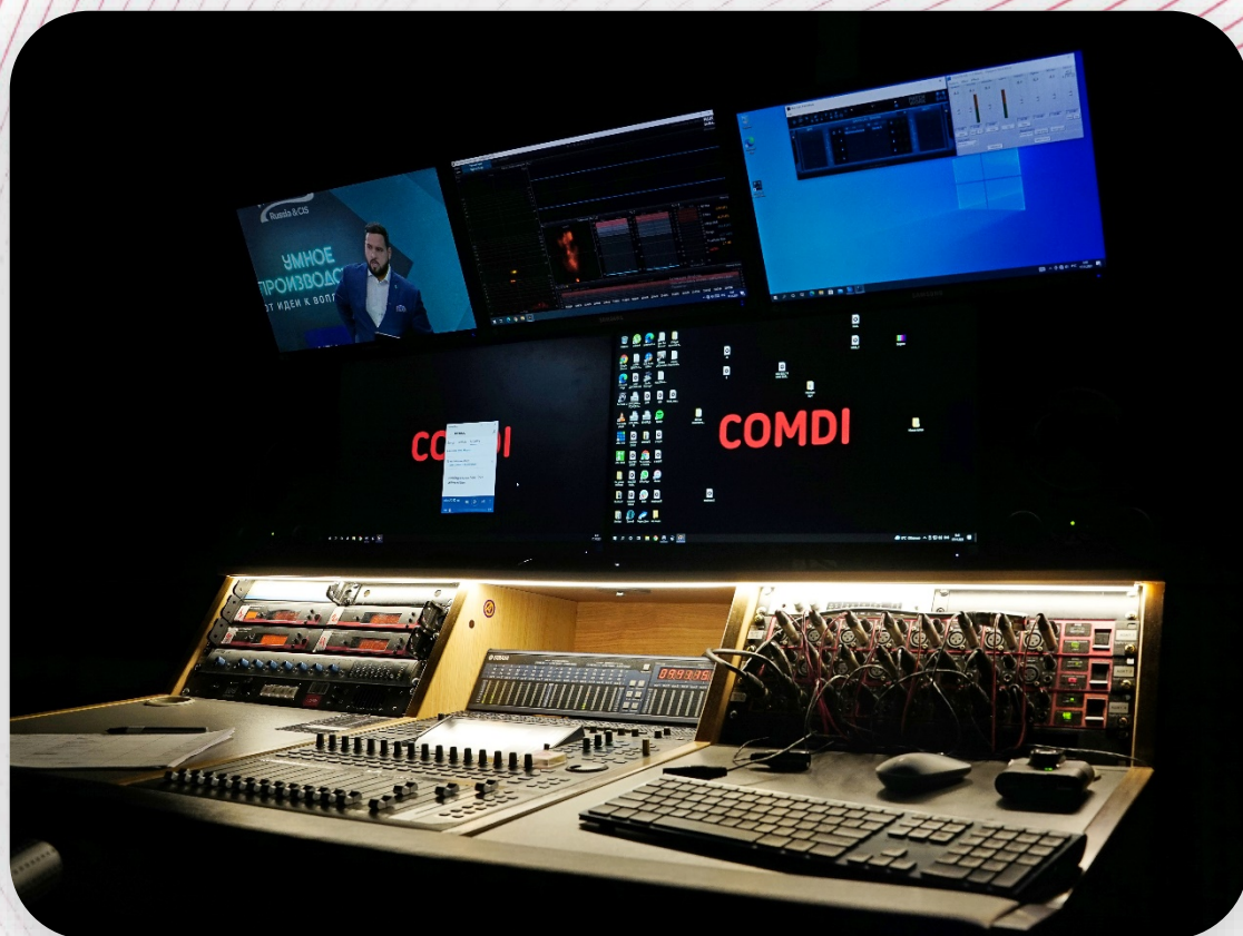
Звуковая COMDI на проекте Klinkmann, 2021

«Задача была еще более амбициозной, поскольку помимо привлечения конечных заказчиков из различных индустрий, было важно пригласить и задействовать системных интеграторов — компании, которые внедряют наши решения. Еще и поэтому второй день форума мы посвятили продуктам, решениям, техническим аспектам».