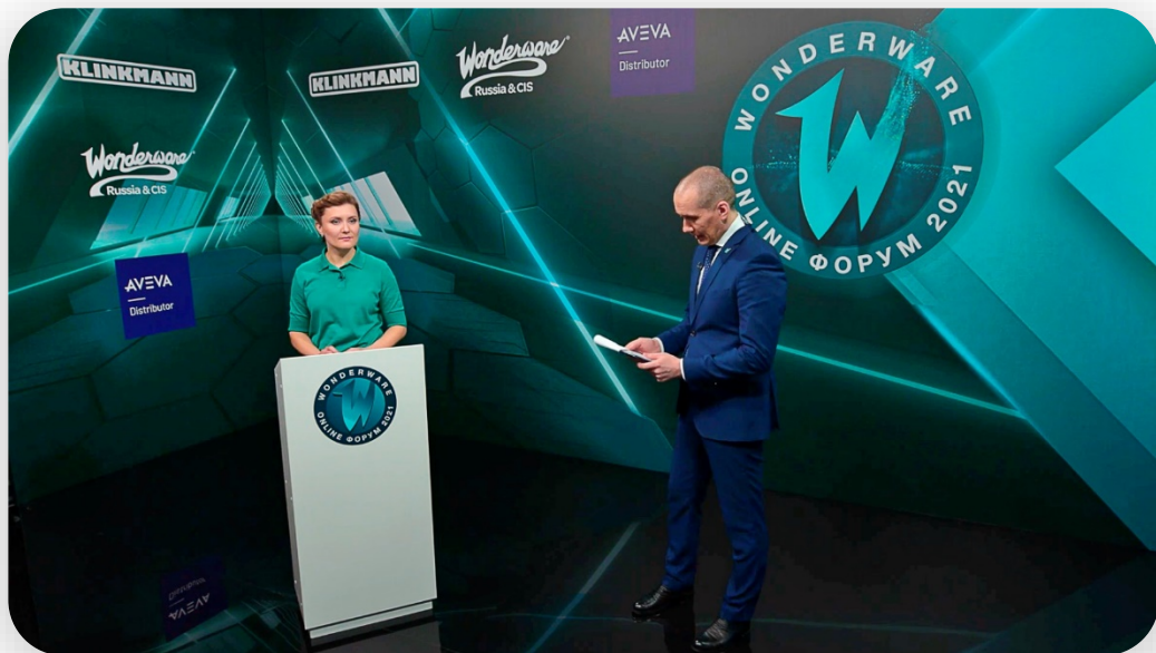
Баннер и профессиональный свет