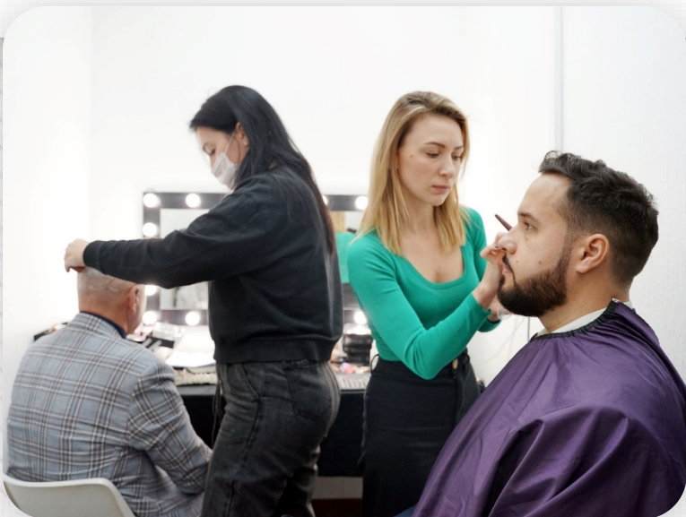
За кулисами форума: работа гримеров

Wonderware Online Forum готовили 2 месяца — COMDI полностью отвечала за сценарий и визуальную часть. На проекте работали 40 специалистов : продюсер, режиссер-постановщик, видеооператоры, инженеры и редакторы эфира, звукорежиссер, осветители, художник по свету, гримеры, микрофонный оператор, гостевые редакторы, которые помогали удаленным спикерам подключаться через Zoom. Синхронный переводчик переводил на русский выступления иностранных спикеров.