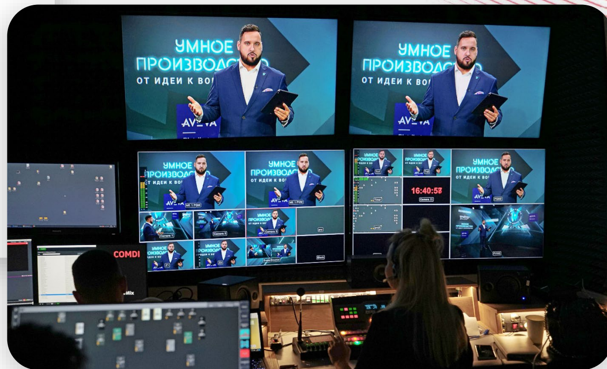
Аппаратная COMDI на проекте Klinkmann, 2021